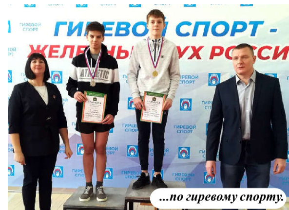
...по гиревому спорту.